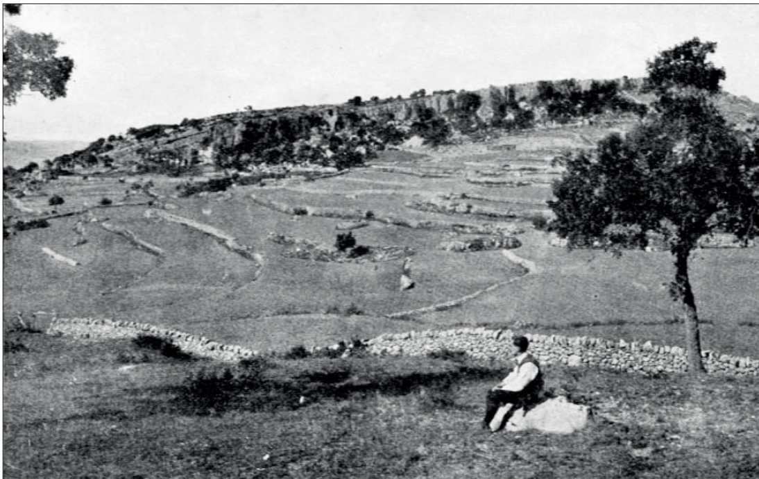
Vista panoràmica de la Mola de Morella la Vella