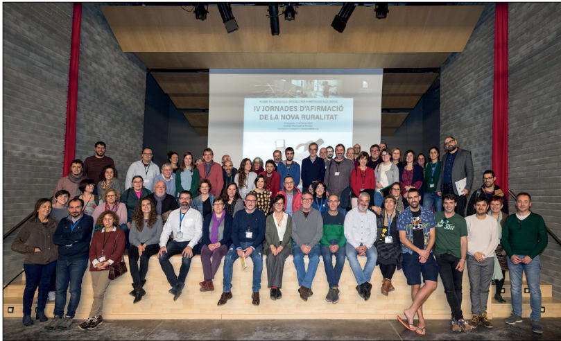
Cloenda de les IV Jornades d'Afirmació de la Nova Ruralitat

Destaca la preocupació respecte la falta de mitjans per a una mobilitat entre municipis i per a desplaçaments a serveis més llunyans. I destaca la inquietud per la falta de previsió davant la situació, que es va agreujant, de crisi climàtica.