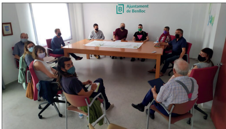
Grup de treball a la jornada preparatòria per a les V Jornades.

https://www.facebook.com/novaruralitat/ @NovaRuralitat