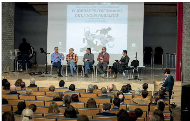
Presentació de la IV Edició per part de membres del Fòrum

- Transport a demanda. Diputació Provincial de Terol i Projectes europeus. Exposició de models europeus de mobilitat i funcionament del sistema de transport a demanda.