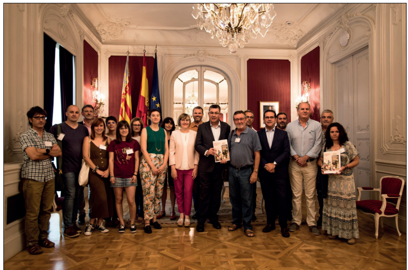
Representants del Fòrum de la Nova Ruralitat amb la Mesa de les Corts Valencianes

Amb la creació del Fòrum de la Nova Ruralitat un grapat de membres formem la coordinadora del Fòrum per a difondre els documents elaborats, dinamitzar accions de divulgació durant tot l'any i preparar les següents edicions de les Jornades de la Nova Ruralitat.