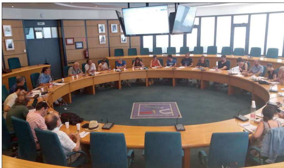
Reunió preparatòria per a les III Jornades d'Afirmació de la NOva Ruralitat. 16 juliol de 2018

Les III Jornades comencen a preparar-se uns mesos abans per a concretar com encarar una nova edició, concretar dates i veure l'estructura organitzativa. A les primeres edicions s'ha analitzat la situació, s'han treballat alguns sectors. La nova ruralitat és un moviment que va agafant força i que cada vegada exigeix més propostes per a intentar minimitzar els efectes del procés de despoblació que es viu als territoris rurals.