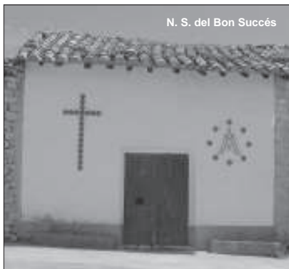
N. S. del Bon Succés